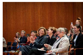
Bei der Transfertagung zum Projekt inno Gründerinnen mit Ministerin Stark-Watzinger.