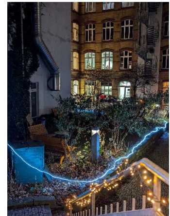
Der festliche Hof beim 35. Jubiläum