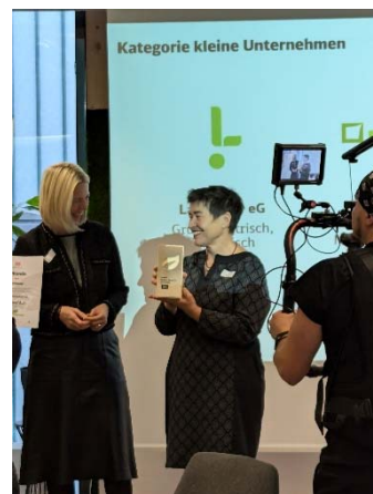
Bei der Preisverleihung des Climate Mobility Awards