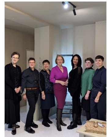
Bundesministerin Lisa Paus zu Besuch