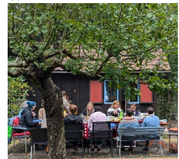
Team beim Betriebsausflug in Biesenthal