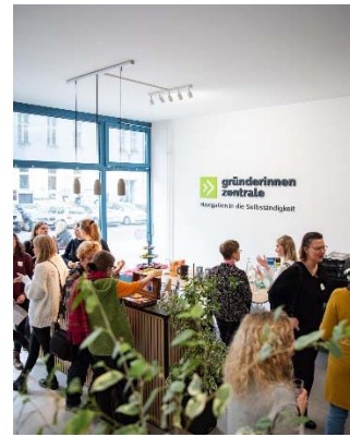
Gründerinnenfrühstück in der neu gestalteten Gründerinnenzentrale

Als zunehmendes Problem angesichts immer heißerer Sommer stellt sich die Frage der Verschattung von Fenstern auf der Südseite heraus. Statt Klimaanlage zur Gebäudekühlung setzen wir zur Lösung auf eine Begrünung der Fassaden. 2024 haben wir dazu eine Machbarkeitsstudie erstellen lassen, die eine fassadengebundene Begrünung aller Südfassaden untersucht. Auf dieser Basis haben wir uns um eine Landesförderung beim Programm BENE2 beworben und sind inzwischen in der zweiten Antragsstufe. Anfang 2025 haben wir ein Planungsbüro mit der Vorplanung beauftragt.